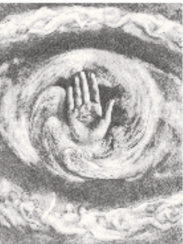
ദി ഡീവൈൻ വേൾഡ്

യാക്കളും സുന്നികളും ഗ്രീക്ക് ഓർത്തഡോക്സും സിറിയൻ ഓർത്തഡോക്സും അർമീനിയക്കാരും കൽദാനികളും മരണനായ വിഭാഗവും ഐക്യത്തോടും സമാധാനത്തോടും ജീവിച്ചിരുന്നു. എന്നാൽ 1845 മുണ്ടായ ആദ്യതര കമഹങ്ങളും ഒട്ടോമൻ ഭരണകൃടത്തിന്റെ അന്വേഷണ നടപടികളും രാജ്യത്ത് അരാജകത്വവും അശാന്തിയും സൃഷ്ടിച്ചു. പട്ടണി പെരുകി, പല ലബനാനികളും ഓഗ്യാനേഷികളായി പല രാജ്യങ്ങളിൽ കുടിയേറി. പഥയനത്തിന്റെ ഏറിയ പങ്കും അമേരിക്കൻ ഐക്യനാ