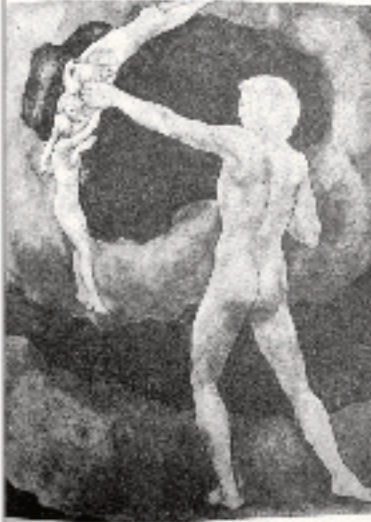
ദി ആർച്ച്ഡ് (ജിബ്രാന്റെ ചെലീൽ)

കുട്ടിക്കാവത്തോരിക്കൽ സൂര്യന്റെ നഗരം എന്നറിയപ്പെട്ടിരുന്ന ബാൽബക്ക് നഗരത്തിന്റെ ബാക്കിയിരിപ്പുകളിലേക്ക് അച്ഛൻ കുട്ടിക്കൊണ്ടു പോയി. കാടിനുള്ളിൽ കുന്നുപോലെ കൃഷിയും കുടിയും ജീർണ്ണാവശിഷ്ടങ്ങൾക്കു നടുവിലുള്ള ക്ഷേത്രത്തിന്റെ ആദിമമായ മൗന വിശുദ്ധിയിൽ നാമു ദിവസം കൂടുംബം കൂടാമടിച്ചു കഴിച്ചുകൂട്ടി. ഒരു പ്രഭാതത്തിൽ, ക്ഷേ