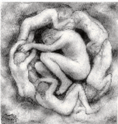
ജീസസ് റി സൺ ഓഫ് മാൻ എന്ന പുസ്തകത്തിനു വേണ്ടി വാച്ചത്

പത്താം വയസിലുണ്ടായ ഒരു വീഴ്ച കാരണം ആഴചകളോളം