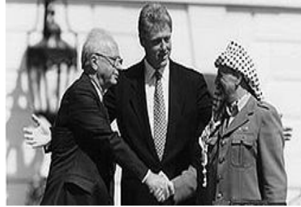
ياسر عرفات وإسحاق رابين مع بيل كلينتون حين اتفاق أوسلو

تأسست منظمة التحرير الفلسطينية عام ١٩٦٤ كمنظمة سياسية شبه عسكرية. كان الهدف الرئيسي من إنشاء المنظمة، هو تحرير فلسطين عبر النضال المسلح. في الخمسينيات والستينيات والسبعينيات من القرن العشرين، كانت المقاومة الفلسطينية مرتبطة بالخطف