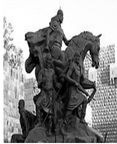
نصب لصلاح الدين الأيوبي في دمشق

الأيوبيون أسرة كردية مستعربة أسسها صلاح الدين الأيوبي حكمت الشام ومصر والحجاز وشمال العراق وديار بكر بجنوب تركيا وجنوب اليمن في القرنين الثاني عشر والثالث عشر الميلاديين. انتزع صلاح