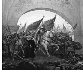
بذلك محمد الفاتح يفتح القسطنطينية

وسقطت القسطنطينية في يدي السلطان العثماني محمد بن مراد الثاني الملقب بمحمد الفاتح سنة ١٤٥٣م، وسماها "إسلام بول" أي مدينة الإسلام، وينهي قرونا من التواجد البيزنطي في المنطقة.