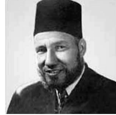
حسن البنا، المرشد العام الأول للإخوان المسلمين

الإخوان المسلمون هي جماعة أسست في مصر في مارس عام ١٩٢٨م كحركة إسلامية، ثم نشأت جماعات أخرى تحمل فكر الإخوان في العديد من الدول، ووصلت الآن إلى ٧٢ دولة تضم كل دول عربية ودولا إسلامية وغير إسلامية في القارات الست. كان حسن البنا (١٩٠٦-١٩٤٩) مؤسس الجماعة ومرشدها الأول.