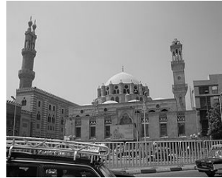
جامعة الأزهر، المؤسسة الدينية العلمية الإسلامية العالمية الكبرى في العالم وثاني جامعة أنشأت في العالم بعد جامعة القرويين

امتدت مرحلة العصر الفاطمي نحو مائتي عام، وسادت روح الترف في هذه الفترة في كل شيء. كان للفاطميين أثر كبير في التاريخ الإسلامي بشكل العام والمصري بشكل خاص، حيث تقدمت العلوم والفنون في عهدهم وكانت القاهرة حاضرة زمانها يفدها الطلاب من أنحاء العالم للتزود بالمعرفة وبنيت بها دار الحكمة وجامعة الأزهر والمكتبات العديدة.