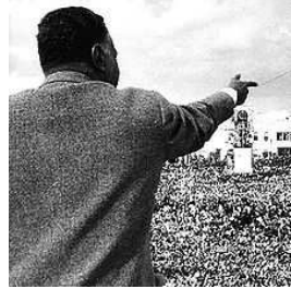
الرئيس المصري جمال عبد الناصر يخطب في الجماهير السورية في ١٩٦١

القومية العربية أو العروبة هي الأيديولوجية القومية العربية، تعتبر هذه الفكرة الأكثر شيوعاً في الوطن العربي خصوصاً في فترة الستينات والسبعينات من القرن العشرين والتي تميزت بجهود الرئيس المصري جمال عبد الناصر لقيام الجمهورية العربية المتحدة بين مصر وسوريا (١٩٥٨-١٩٦١).