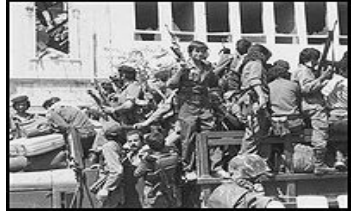
مغادرة مقاتلي منظمة التحرير الفلسطينية لبيروت إلى تونس

حرب لبنان ١٩٨٢ هي حرب عصفت بلبنان فتحوّلت أراضيها إلى ساحة قتال بين منظمة التحرير الفلسطينية وسوريا وإسرائيل. ترجع أسباب هذه الحرب إلى وجود الفصائل الفلسطينية المسلحة في لبنان، والحرب الأهلية اللبنانية. بدأت