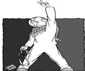
رسم يرمز لانتفاضة الشعب الفلسطيني بريشة كارلوس لاتوف

أعلن الشيخ أحمد ياسين في ١٩٨٧ عن تأسيس حركة حماس. فاندلعت الانتفاضة الفلسطينية ضد الاحتلال الإسرائيلي في الفترة من ١٩٨٧ وحتى ١٩٩٤. كانت الانتفاضة الأولى (انتفاضة