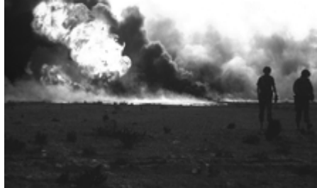
صورة لأحد الأبار المحترقة

للعراق، في ٤ أغسطس ١٩٩٠، واحتلتها لمدة سبعة أشهر. وانتهى الاحتلال العراقي بتحرير الكويت في ٢٦ فبراير ١٩٩١ بعد