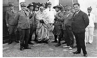
عمر المختار أسيرا بين الإيطاليين

السنوسية حركة فكرية ثقافية كالحركة الوهابية بنجد، وكحركة جمال الدين الأفغاني ومحمد عبده، وكالحركات الصوفية بشمال